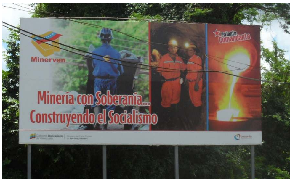
Figure n°2 : L'exploitation minière contrôlée par l'entreprise nationale CVG-Minerven

El Callao, État Bolívar, juillet 2012.